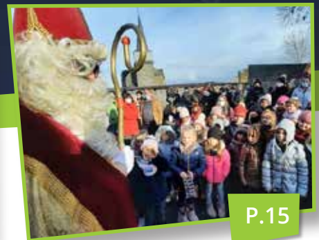
• Saint-Nicolas à l'école de Compogne